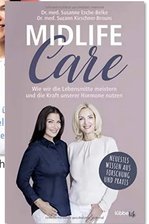
Lübbe Life 2020